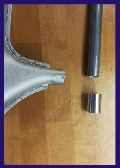
Vorbereitung zur Lackierung