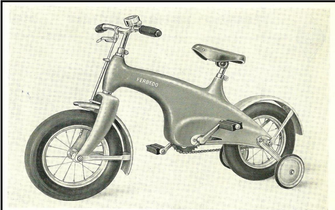
„FERBEDO“ ZWEIRAD-BICYCLE MODELL 126 St