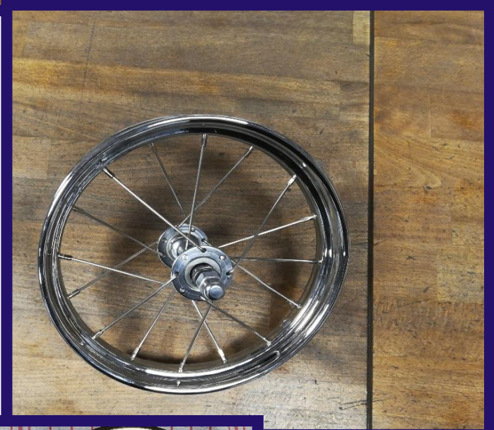
Räder und Reifen