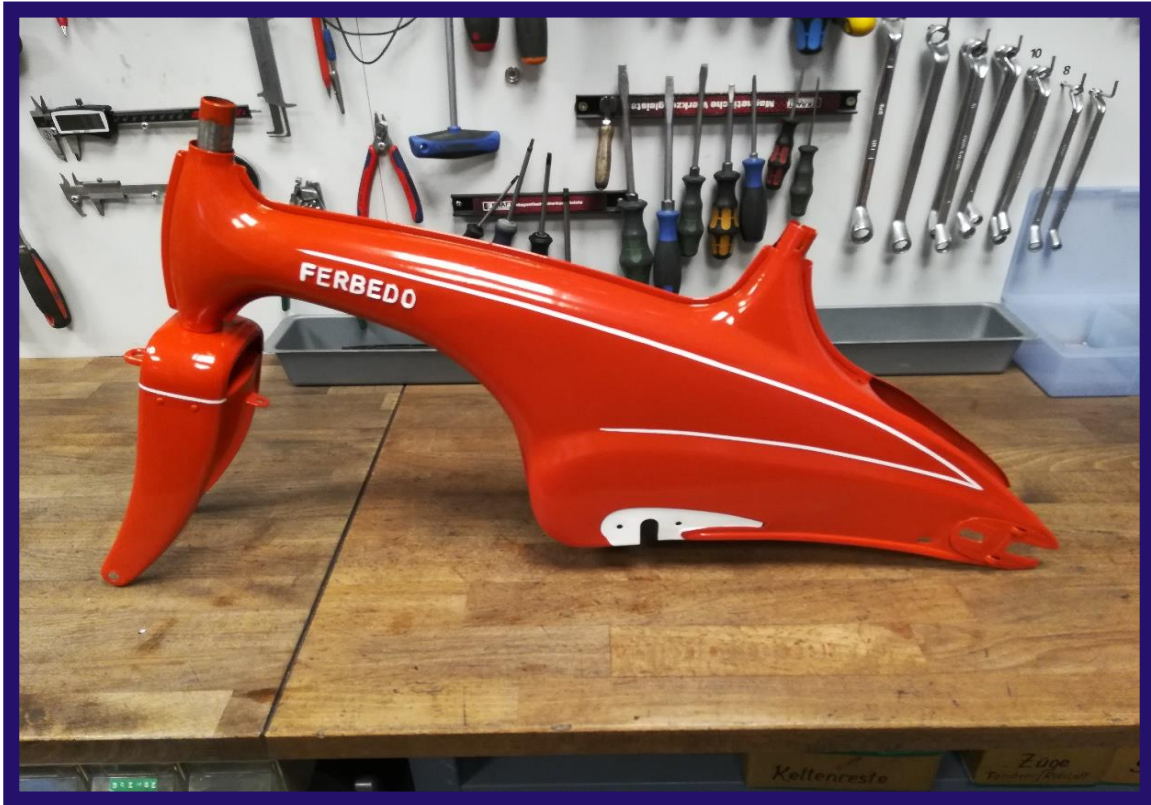
Beginn der Montage