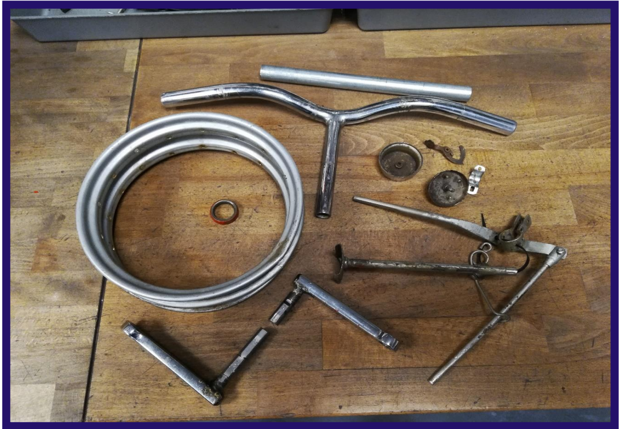
Chrom: vorher, nachher